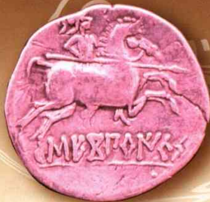
Figure 2 : Monnaie de l'atelier ibérique de SEGOBRIGA faisant partie du trésor de Barcus, conservée au Musée de Pau.